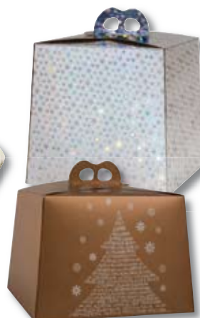
CAJAS DE PANETONE