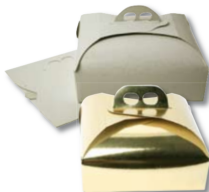
CAJAS DE TARTAS

BAJO ENCARGO. Consultar medidas. Personalizables en cantidades pequeñas.