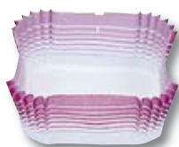
CUADRADA 10 36 x 36 x 17 mm.