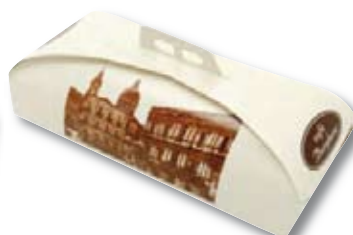
CAJAS DE BRAZO