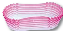
OVALADA 08 24 x 44 x 15 mm. 09 26 x 56 x 17 mm. 13 28 x 78 x 24,5 mm. 88 40 x 105 x 25 mm.