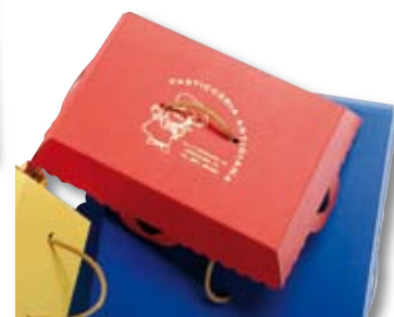
CAJAS DE PASTAS