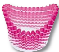
BARCA 08 24 x 17 x 27 mm.