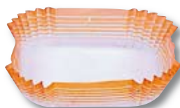
RECTANGULAR 21 30 x 87 x 22 mm. 24 35 x 93 x 31 mm.