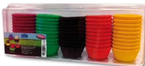
Ref: 02CS10B CÁPSULAS 10BIS 53 x 32,5 mm. Colores surtidos. 1000 und.