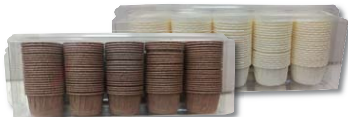
Ref: 02CSPBAE66M CÁPSULAS 10BIS 52 x 40 mm. Marrón o blanca. 115 und.